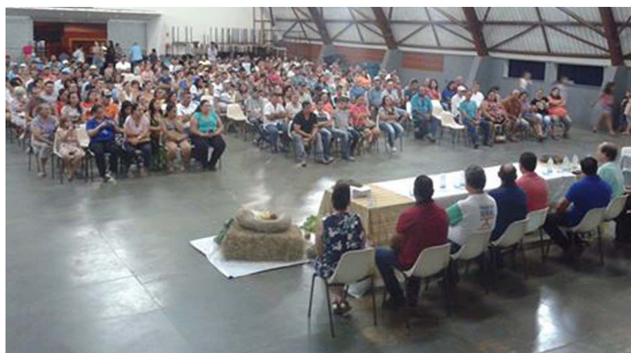
Reunião no Salão Paroquial de Angatuba

O Centro Pastoral de Angatuba lotou na noite de quarta-feira (15/03) com as presenças de autoridades municipais e agricultores de todo o município. O objetivo desta grande reunião foi estabelecer as regras para esta nova etapa do Programa de Aquisição de Alimentos (PAA), do Governo Federal, que tem como objetivo fortalecer a agricultura familiar. Neste ano, com repasse de R$ 800 mil, valor bem menor do que nos anteriores, é necessário que os agricultores respeitem ao máximo possível os critérios exigidos pela suas adesões, pois se não for assim será mais difícil ainda de enfrentar a crise que também é forte no setor. De parte do prefeito, em sua fala ele garantiu que a prefeitura, que é a intermediária entre o PAA e os agricultores, estará sempre ao lado deles naquilo que lhe for possível