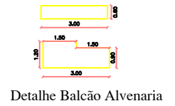
Detalhe 01 Escala 1:100 ■ Demolição ■ Alvenaria ■ Placas de gesso encartonado